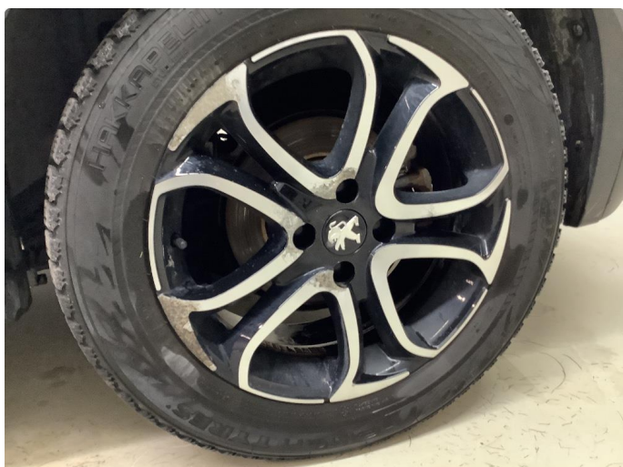
1.2 Betydelig oksidering - 4 stk. vinterhjul