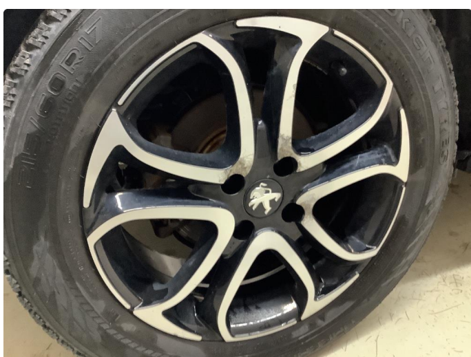
1.2 Betydelig oksidering - 4 stk. vinterhjul