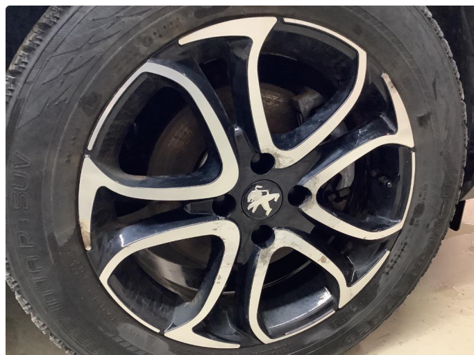
1.2 Betydelig oksidering - 4 stk. vinterhjul