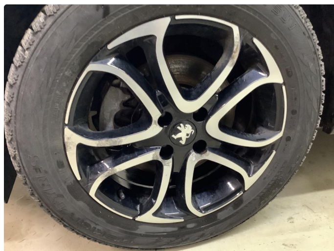
1.2 Betydelig oksidering - 4 stk. vinterhjul