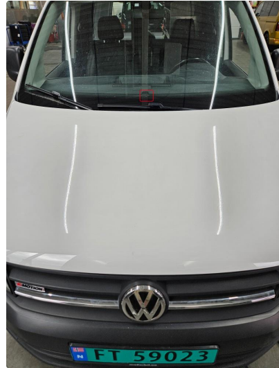
1.3 Steinsprut utenfor synsfelt