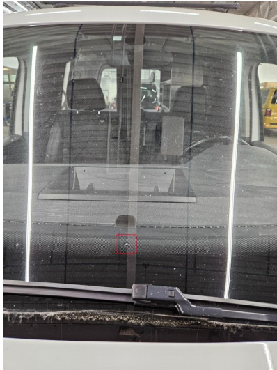
1.3 Steinsprut utenfor synsfelt