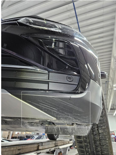
1.1 Skrubb på underkant frontfanger