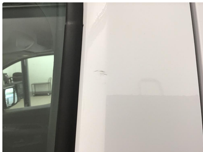
1.2 Ripe ned til grunning