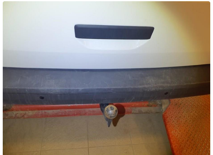
1.2 Skrapemerker bak