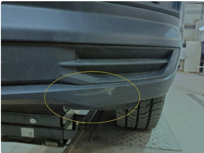
1.1 Noe subbeskader.