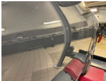
32. Lakk / karosseri utvendig