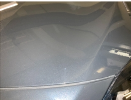
31. Lakk / karosseri utvendig