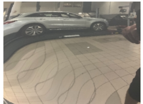
33. Lakk / karosseri utvendig