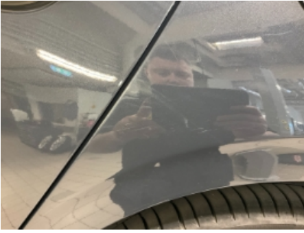
37. Lakk / karosseri utvendig