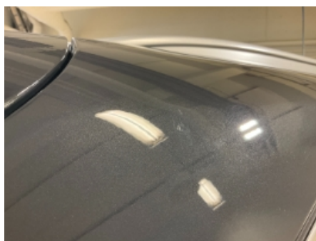
35. Lakk / karosseri utvendig