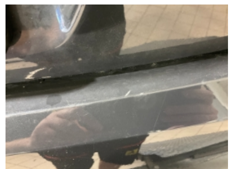
36. Lakk / karosseri utvendig