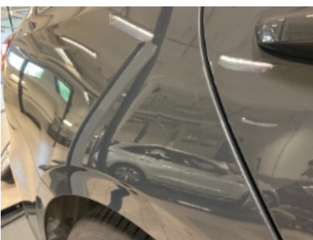
34. Lakk / karosseri utvendig