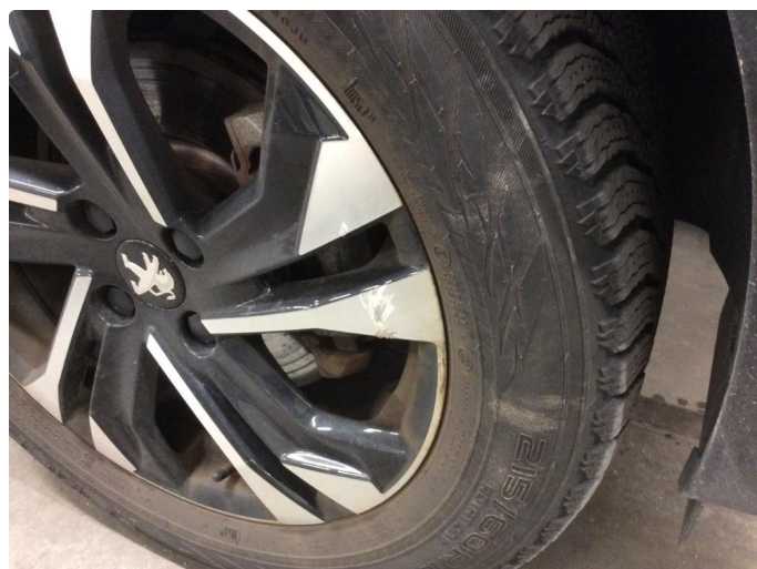
1.2 1 stk kantkjørt felg vinterhjul