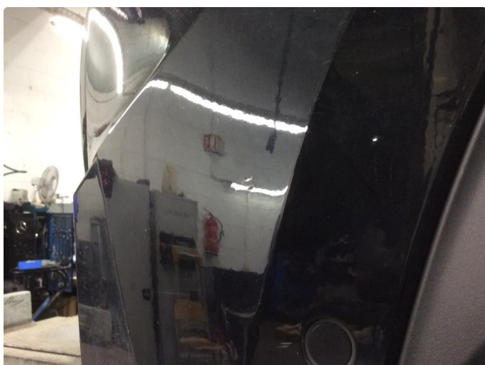
1.3 Lite synlige merker i lakk på støtfanger foran