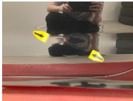
20. Lakk / karosseri utvendig