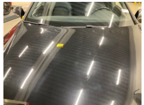
18. Lakk / karosseri utvendig