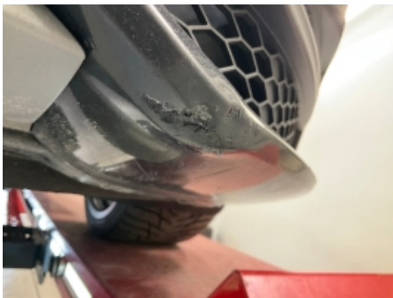
31. Lakk / karosseri utvendig