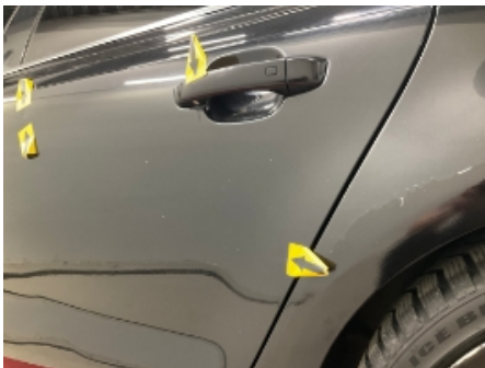
19. Lakk / karosseri utvendig