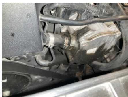
23. Utvendig tilstand motor