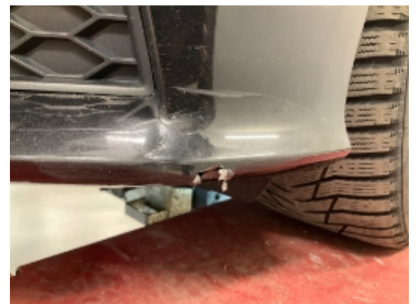
30. Lakk / karosseri utvendig