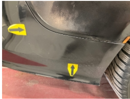
26. Lakk / karosseri utvendig