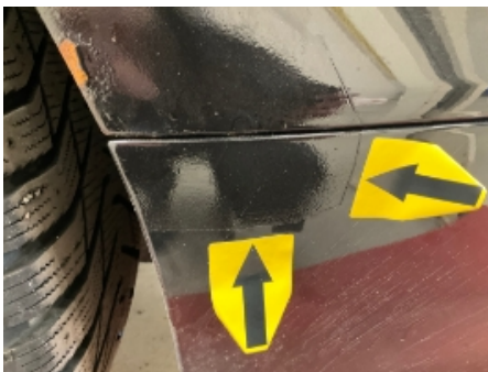
28. Lakk / karosseri utvendig