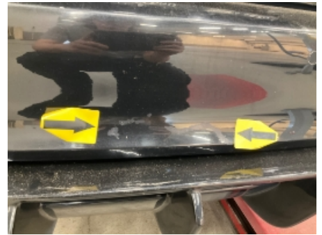
27. Lakk / karosseri utvendig