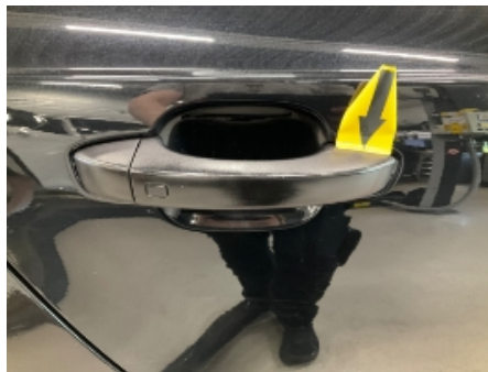
44. Lakk / karosseri utvendig