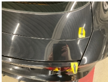
29. Karosseri generelt