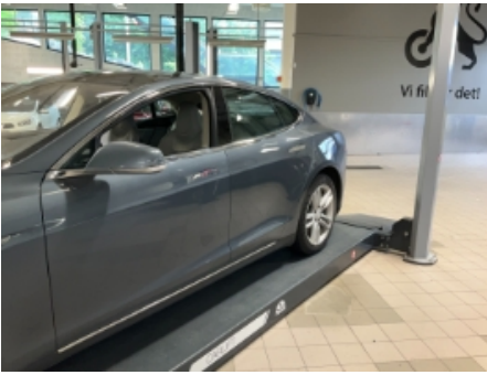
37. Lakk / karosseri utvendig