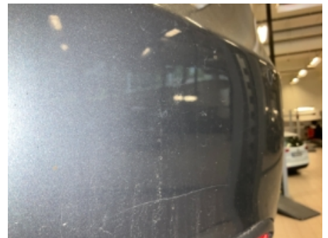
33. Lakk / karosseri utvendig