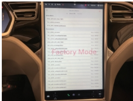
20. Full systemskann