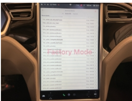
22. Full systemskann