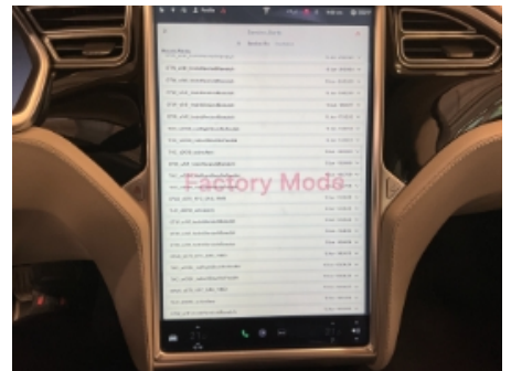
21. Full systemskann