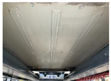
36. Utv. tilstand fremdriftsbatteri elbil/hybrid