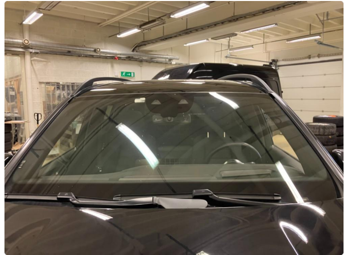
1.1 Frontruten er restet og forventet byttet i juni/juli.