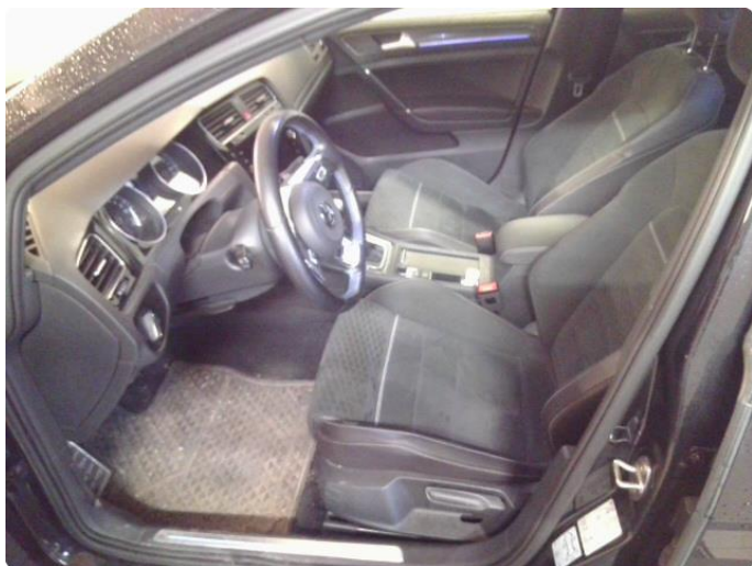
3.1 Øvrig opplysninger