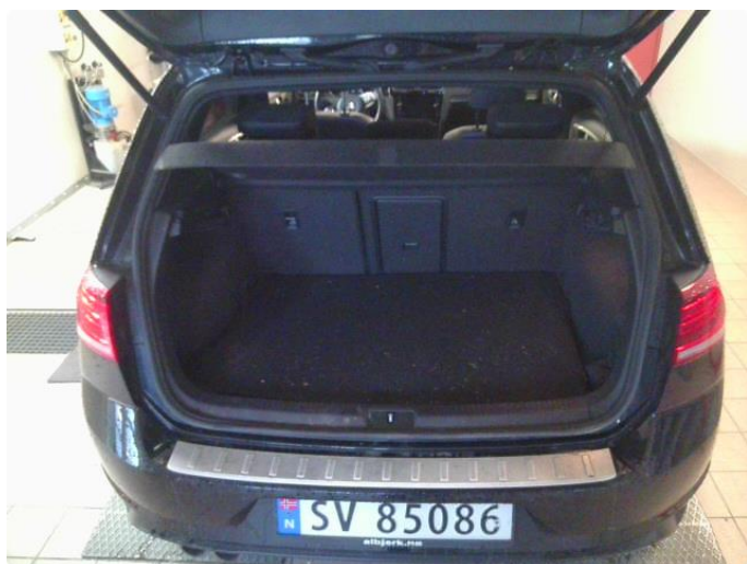
3.1 Øvrig opplysninger