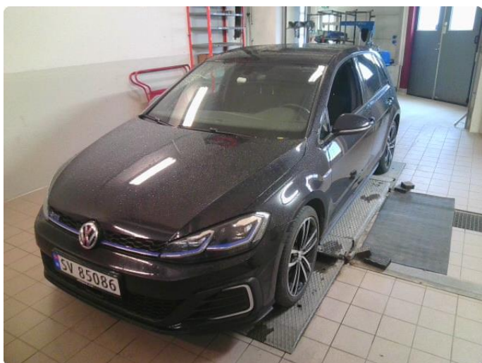
3.1 Øvrig opplysninger