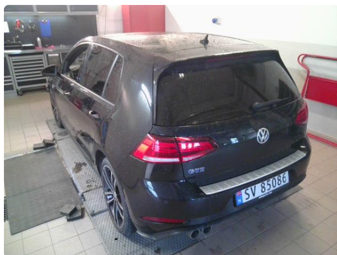
3.1 Øvrig opplysninger