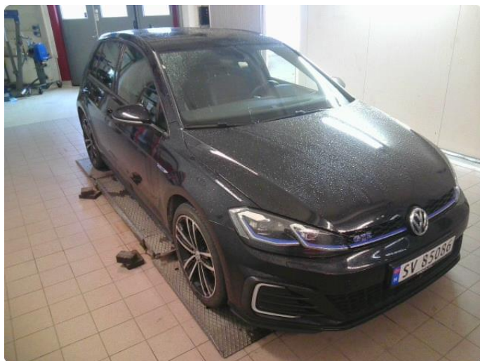
3.1 Øvrig opplysninger