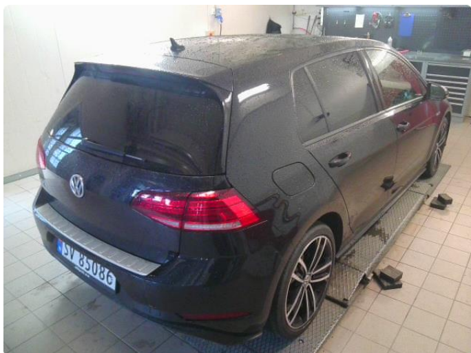
3.1 Øvrig opplysninger