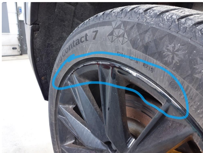
1.4 Kantkjørt felg