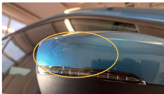
1.2 Småriper på speildeksel