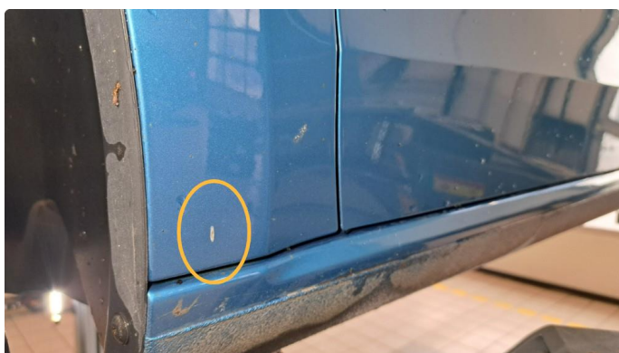
1.1 Ripe(r) ned til grunning