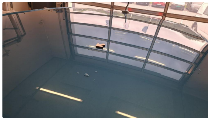
1.5 Liten bulk