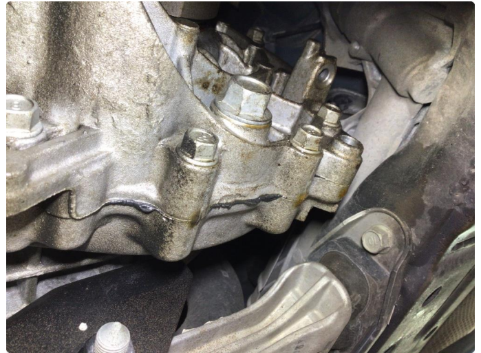
3.1 Girkasse lekkasje