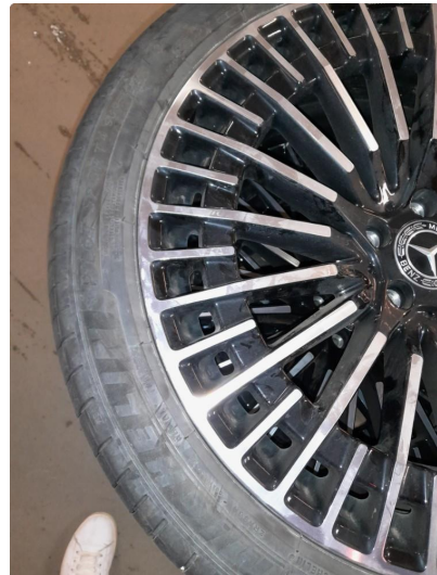
1.1 Bruksmerker på felger