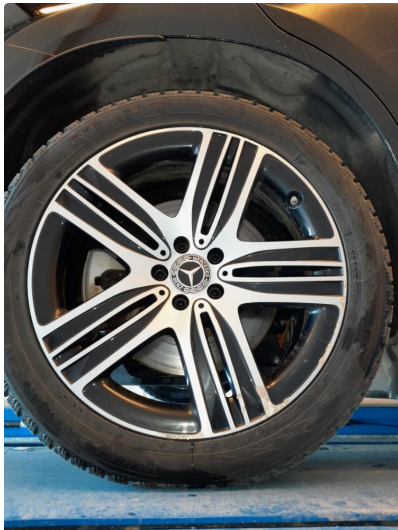
1.1 Bruksmerker på felger