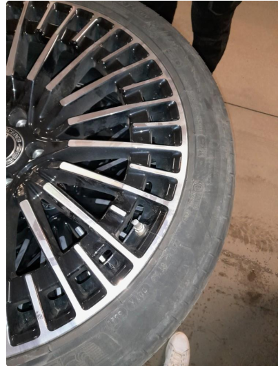
1.1 Bruksmerker på felger