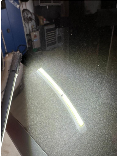
1.1 Steinsprut med rust