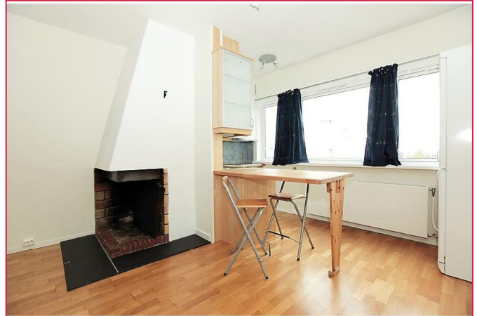
Barløsningen på kjøkkenet kan felles ned.