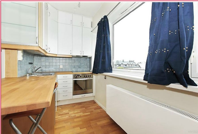
Flott utsikt fra leiligheten