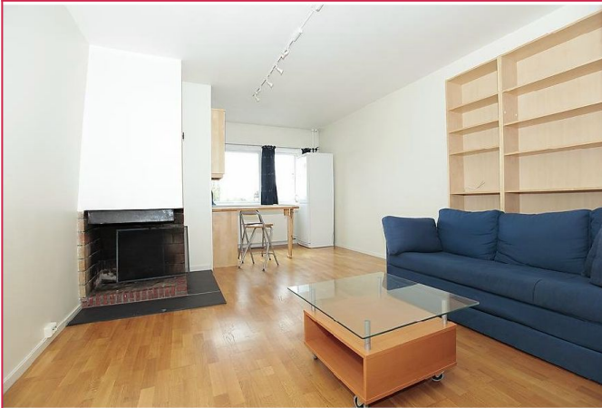
Stue med god takhøyde.