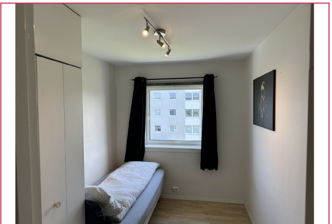
Soverom nr. 2