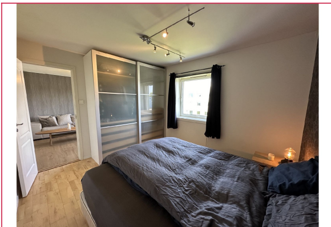
Soverom nr. 1