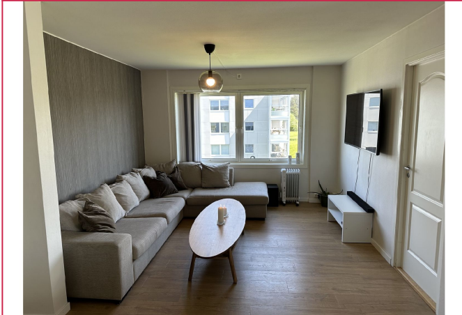
Stue - sofa følger ikke med