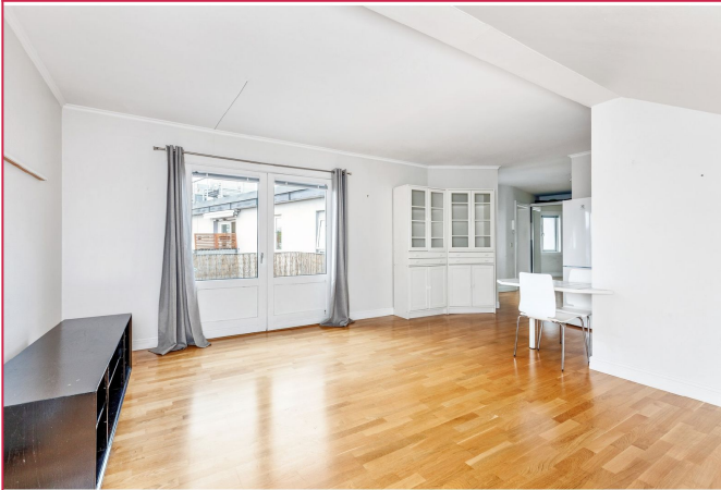
Grunnpakke TV og internett er inkludert