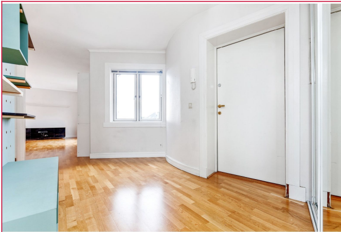
Romslig entre med skyvedørgarderobe