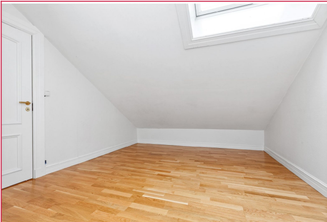
Soverom med garderobeskap og tilgang til bod/garderobe