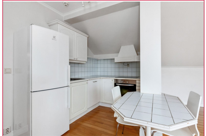
Kjøkken med kombiskap, oppvaskmaskin, komfyr og platetopp