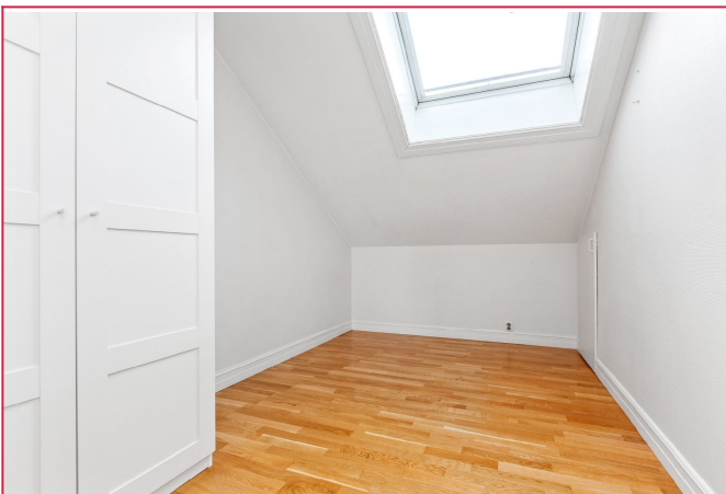
Soverom 2 med garderobeskap og mye lagring knevegg