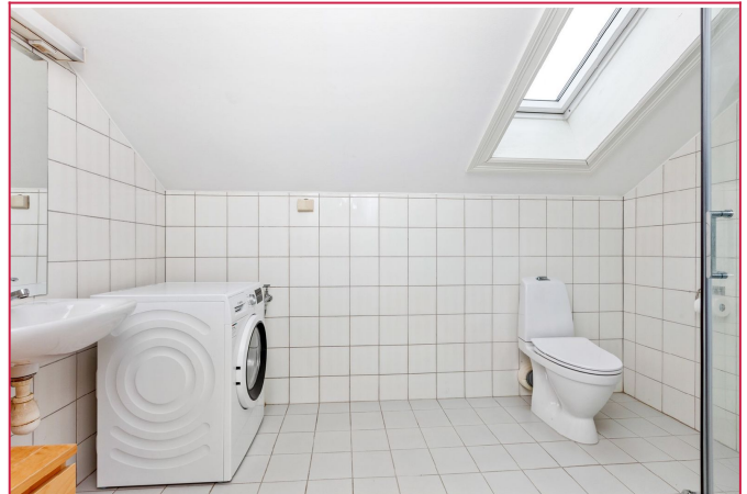
Flislagt bad med varme i gulv, vaskemaskin og dusjkabinett