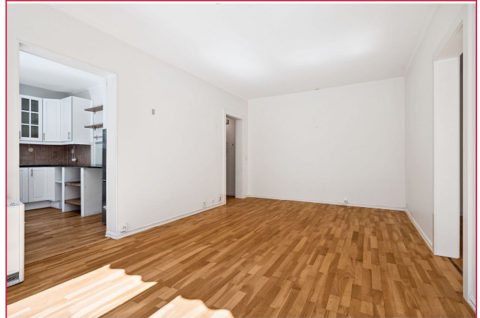
Romslig stue med flere møbleringsmuligheter.