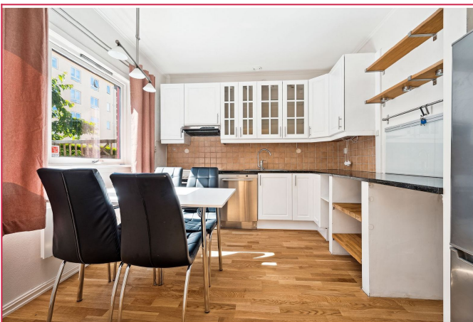
Stort og separat kjøkken.