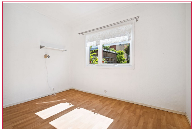
Soverom av god størrelse. På soverommet er det garderobeskap med skyvedører.