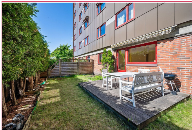
Flott og skjermet hage som følger med leiligheten.