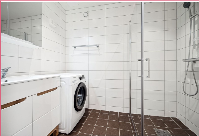
Renovert badrom i 2024.