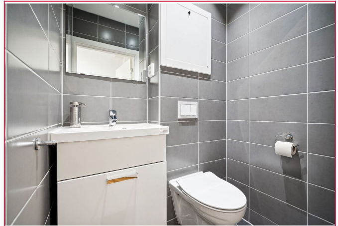
Renovert toalett i 2024.