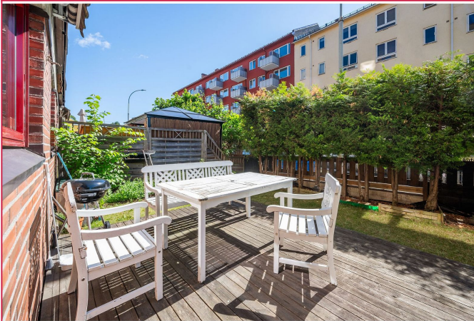
Leiligheten ligger stille og rolig til, og har en egen hageflekk med platting som kan benyttes.