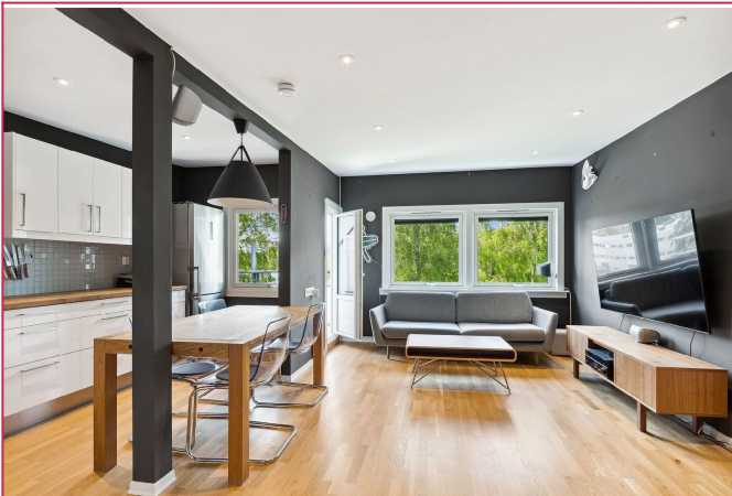
Stue med utgang til balkong