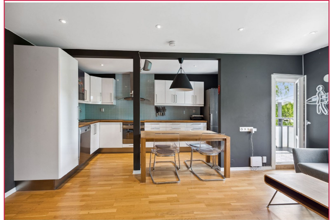
Kjøkken fra stue