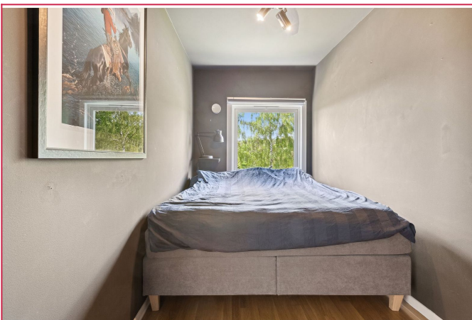
Soverom. Mye garderobeplass.