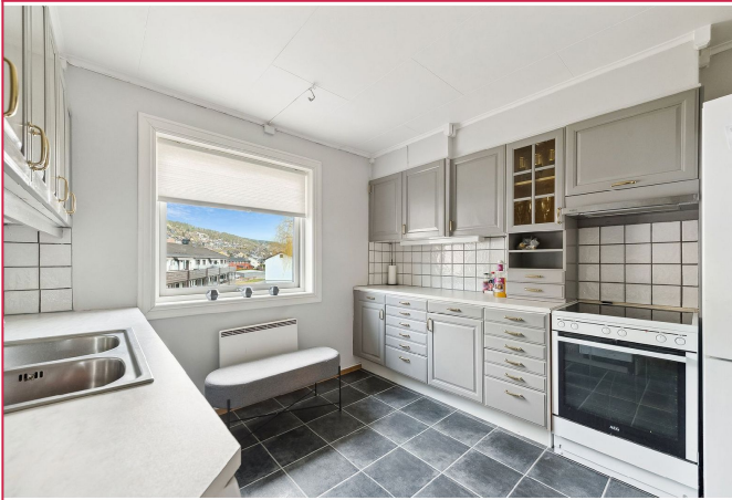
Kjøkken med kombiskap, komfyr og oppvaskmaskin.