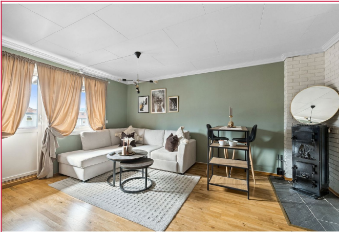
Vedovn i stue.