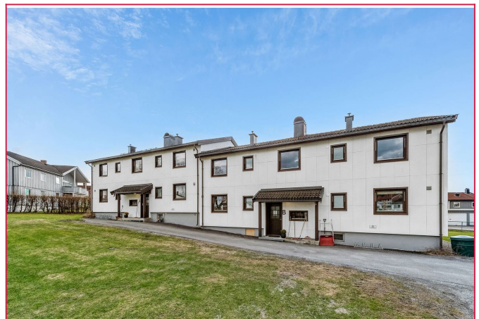
Fasade, leiligheten ligger i 2. etasje.