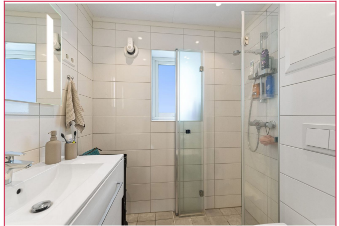
Nyere bad med vegghengt toalett og baderomsinnredning. Flislagte vegger og gulv, varmekabler i gulv.