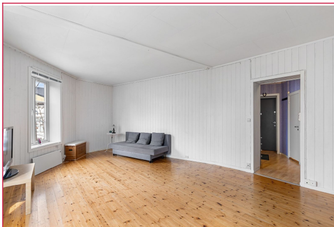
Lys og tiltalende stue med store vinduer som sørger for gode lysforhold. Sofa medfølger.