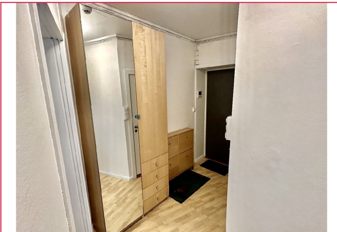
Her ønskes du velkommen hjem ved en lys og innbydende entré med god plass til å sette fra seg sko.