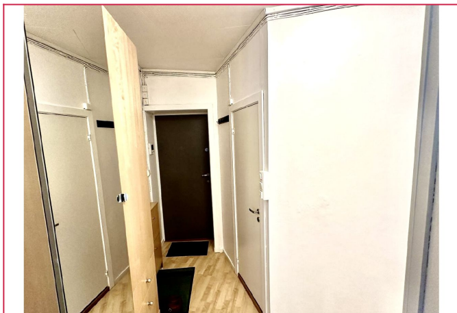
Leiligheten er nymalt.