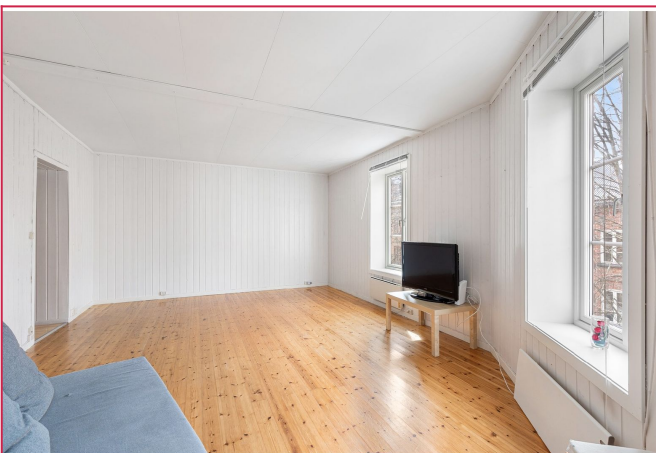
Stor stue med gode møbleringsmuligheter.