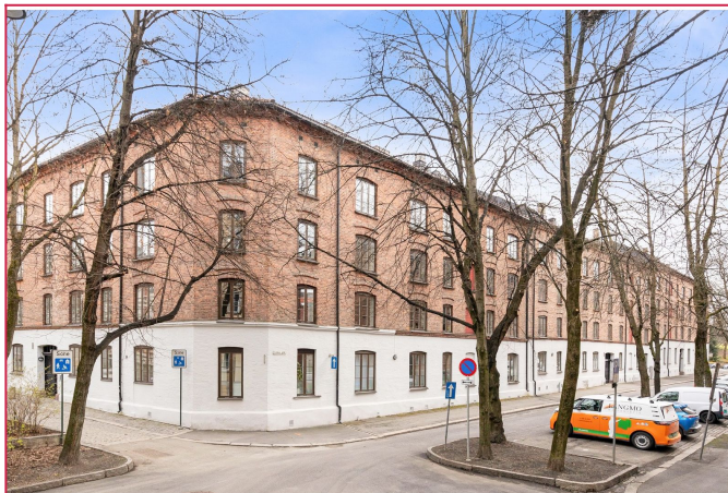
Attraktiv 2-roms hjørneleilighet med sentral og attraktiv beliggenhet i populære Gråbeinkvartalet.