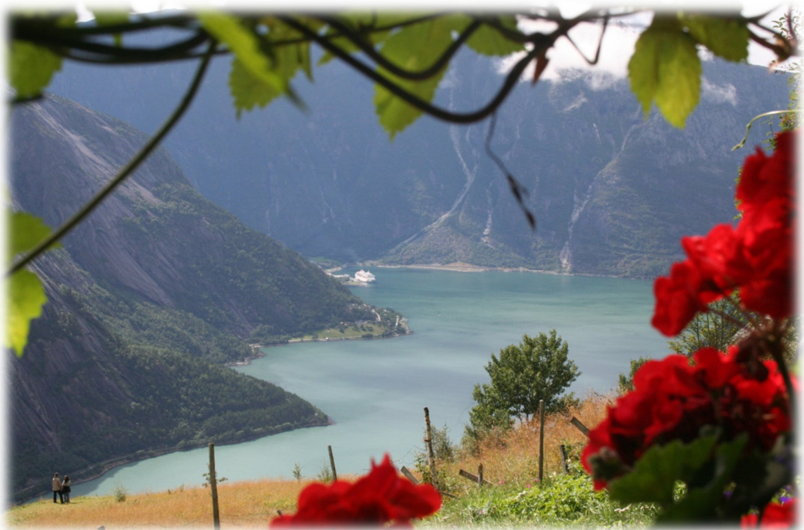
Kjeåsen - Eidfjord