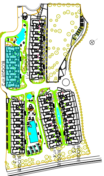
bloque 2 ordenacion general