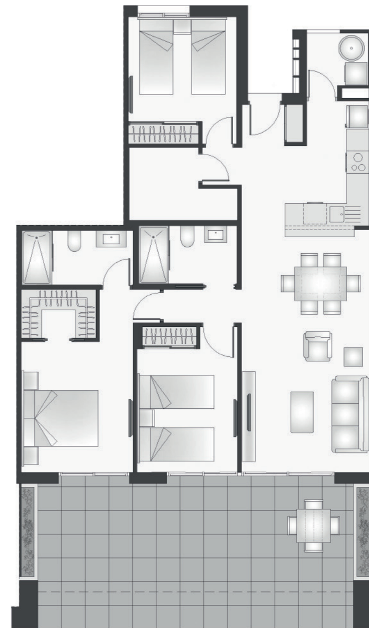
Apartamento TIPO K - 3 dormitorios + 2 Baños - Planta Baja Apartment K Type - 3 Bedroom + 2 Bathroom - Ground Floor