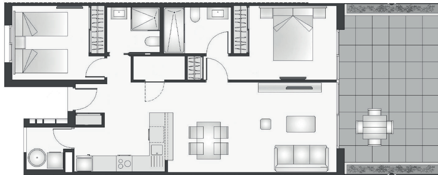
Apartamento Tipo B - 2 dormitorios + 2 Baños Apartment B Type - 2 Bedroom + 2 Bathroom.