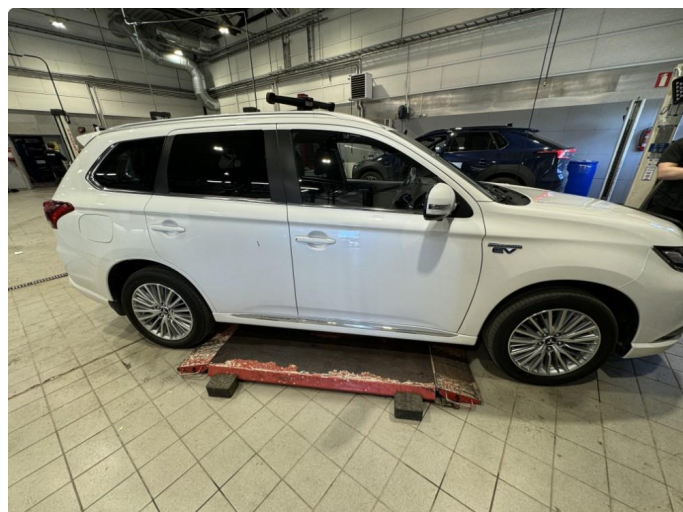
1.1 Mindre riper/bruksmerker