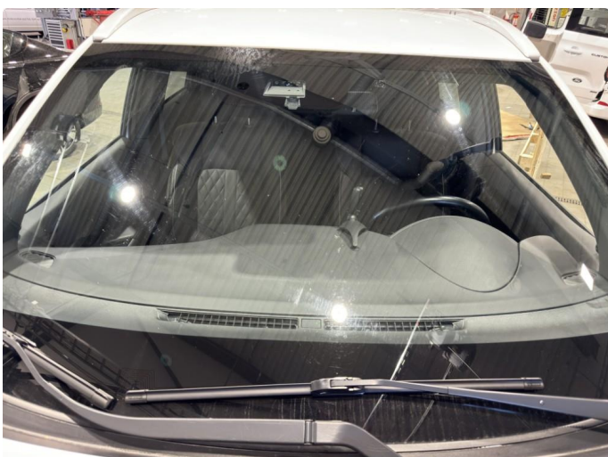
1.3 Øvrige feil