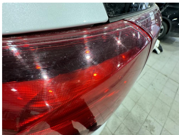
2.1 OK ny lykt bestilt 05/24. Sprekk i lys bak.