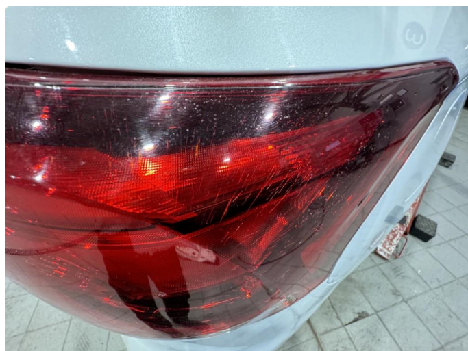
2.1 OK ny lykt bestilt 05/24. Sprekk i lys bak.