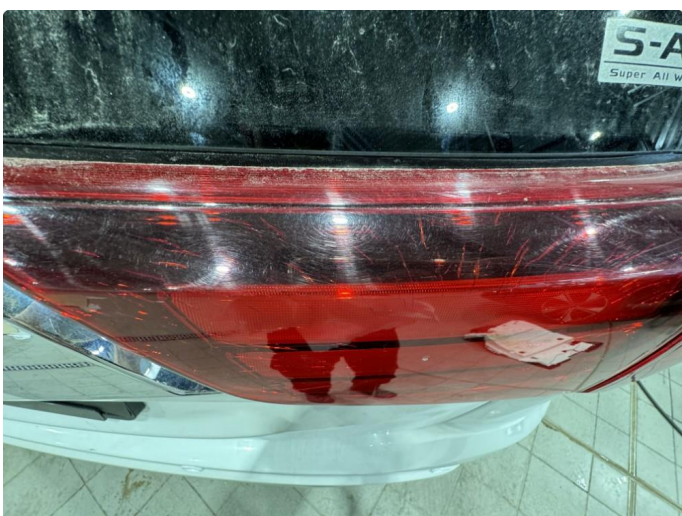
2.1 OK ny lykt bestilt 05/24. Sprekk i lys bak.