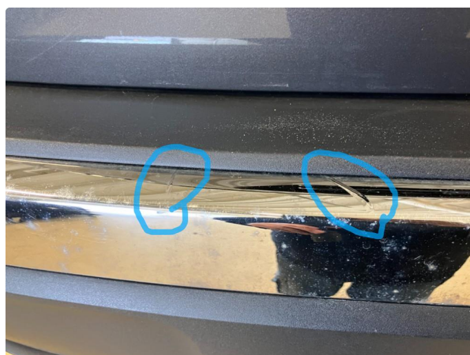
1.2 Skal inn på verksted for kontroll/utbedring 31.05