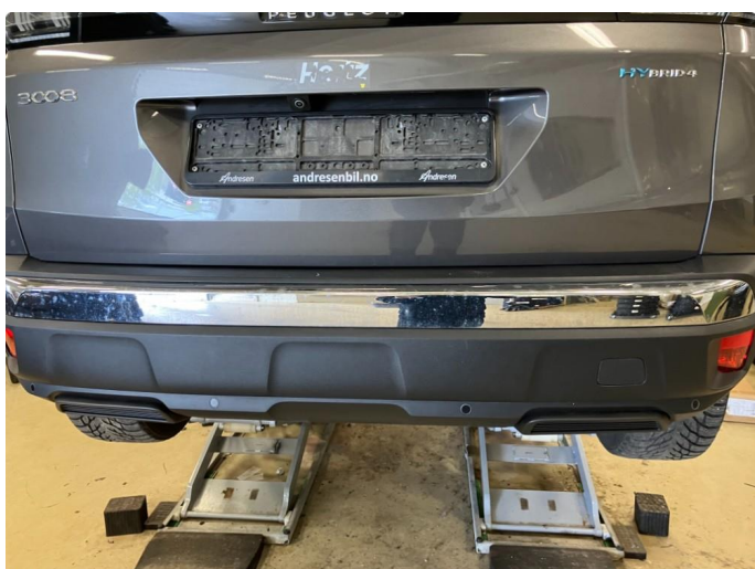
1.2 Skal inn på verksted for kontroll/utbedring 31.05