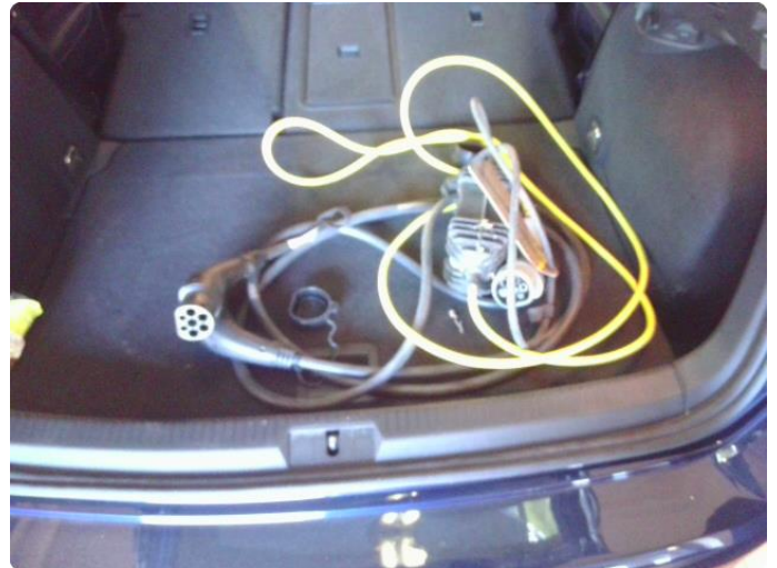
1.1 Sommerdekk, vinterdekk, ladekabel, hattehylle