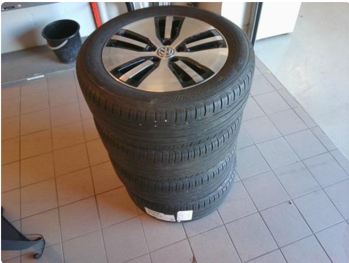
1.1 Sommerdekk, vinterdekk, ladekabel, hattehylle