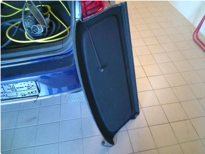
1.1 Sommerdekk, vinterdekk, ladekabel, hattehylle