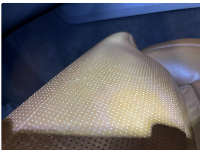
1.3 Skade på setepute