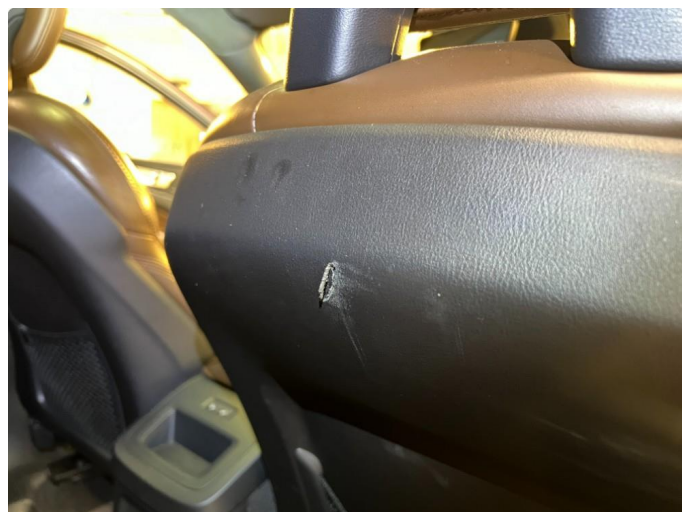
1.2 Skade på seterygg