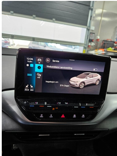
2.1 Service info