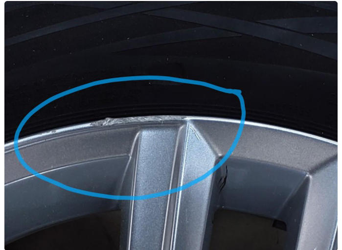
1.1 Kantkjørt felg