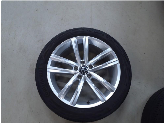
1.1 Kantkjørt felg