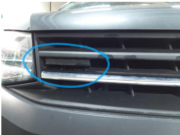
1.3 Øvrige feil