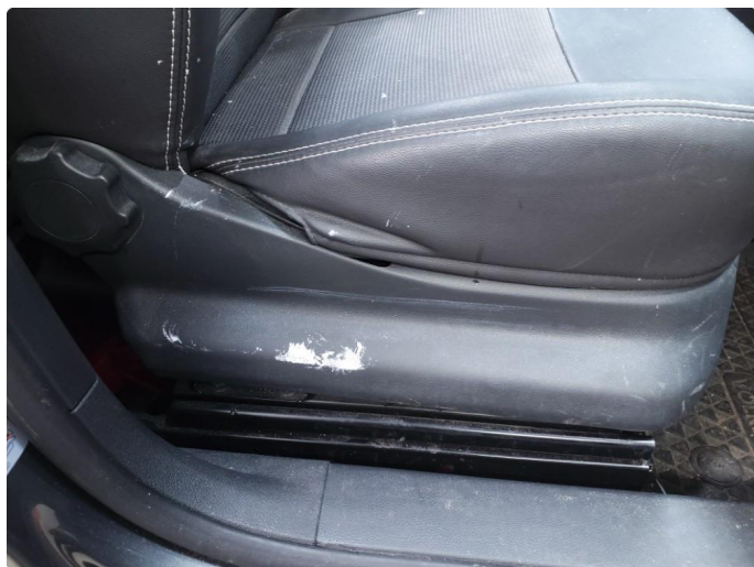
2.1 Øvrige feil