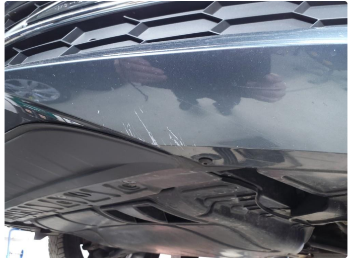
1.1 Skrubbskader underkant