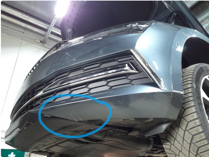
1.1 Skrubbskader underkant