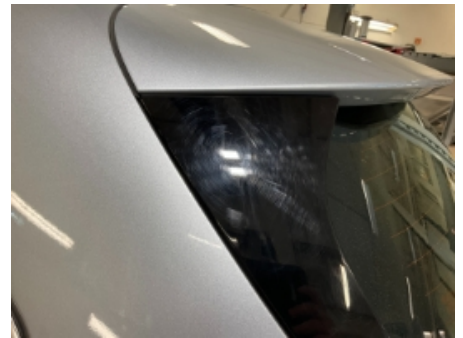
42. Lakk / karosseri utvendig