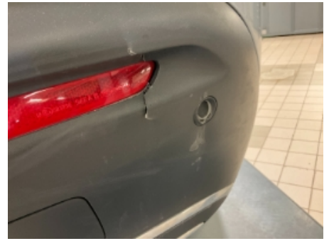
39. Lakk / karosseri utvendig