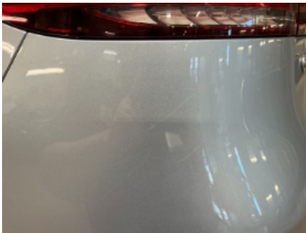
40. Lakk / karosseri utvendig