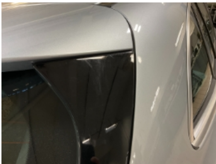
43. Lakk / karosseri utvendig