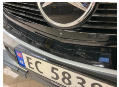
33. Lakk / karosseri utvendig