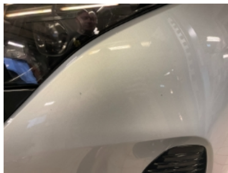
32. Lakk / karosseri utvendig