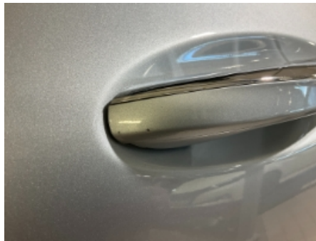
41. Lakk / karosseri utvendig