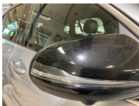
35. Utvendig speil