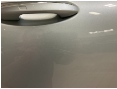
37. Lakk / karosseri utvendig