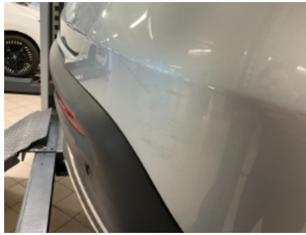
38. Lakk / karosseri utvendig