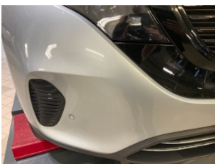
34. Lakk / karosseri utvendig