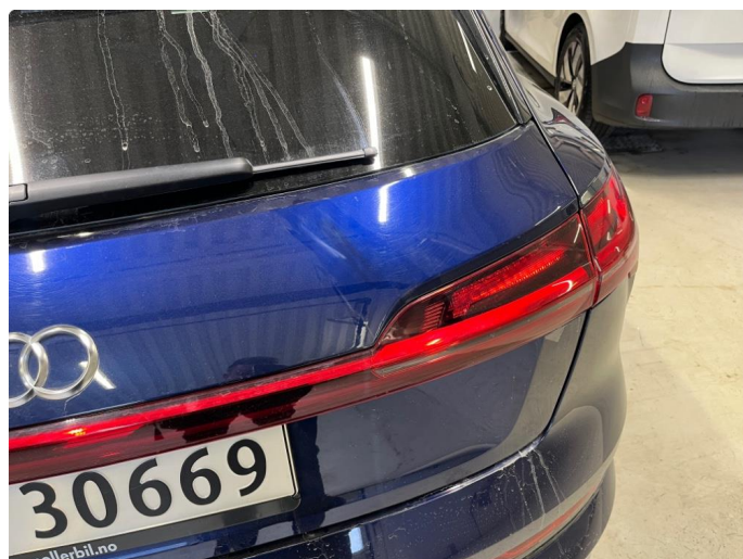
1.2 Ripe som tidligere er flekket.