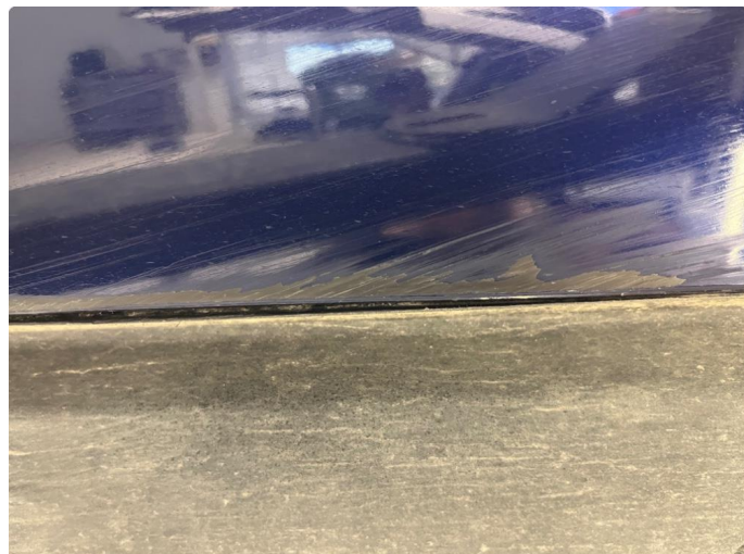
1.1 Liten skramme under dør