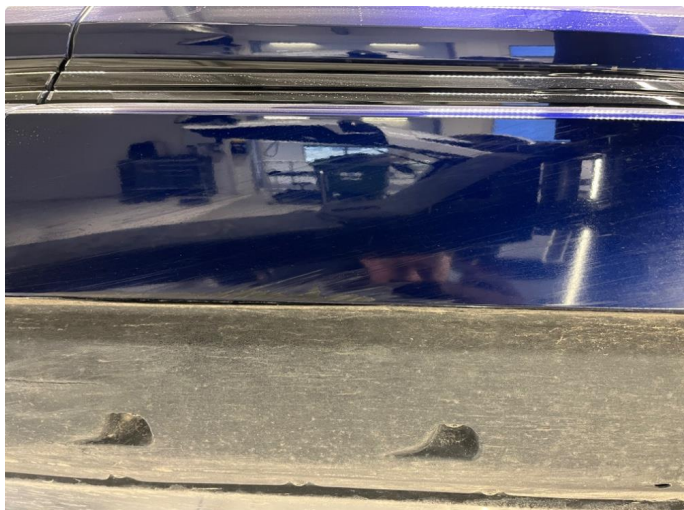
1.1 Liten skramme under dør