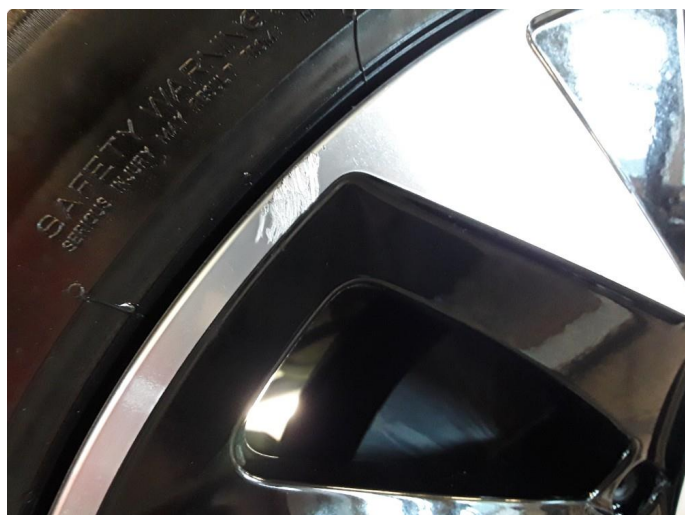
1.2 2 noe kantkjørte sommrefelger.