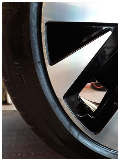
1.2 2 noe kantkjørte sommrefelger.