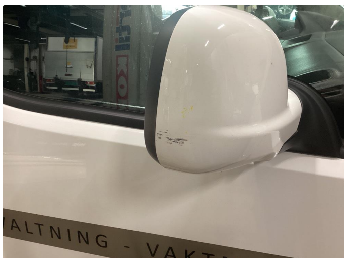
1.3 Riper i høyre speilhus som flekkes før levering