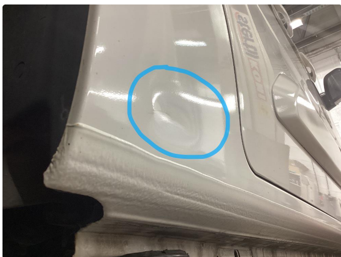
1.7 Bulk uten lakkskade