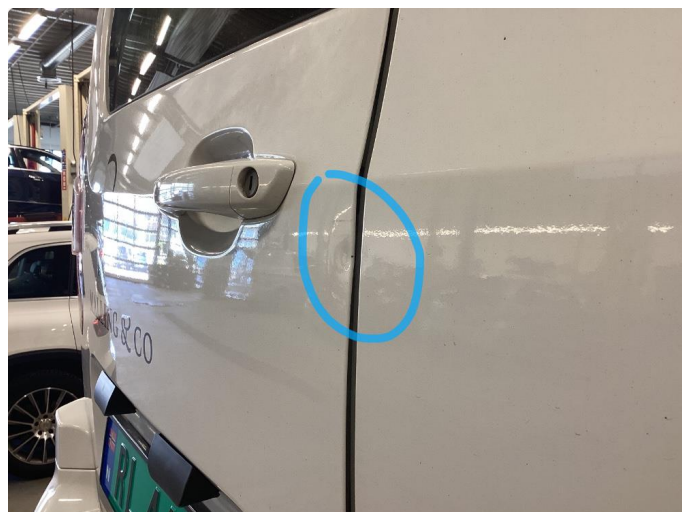
1.2 Bulk uten lakkskade i baddør