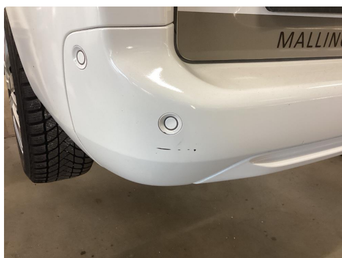
1.5 Riper/merker som blir flekket på plastfanger bak