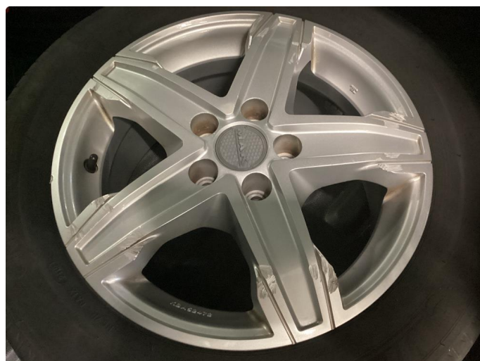
1.4 Kantskjørt felg