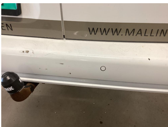
1.5 Riper/merker som blir flekket på plastfanger bak