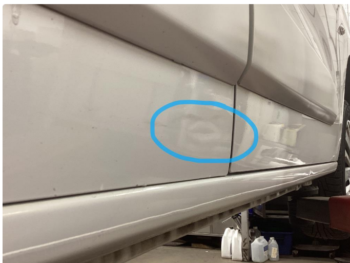
1.1 Bulk uten lakkskade