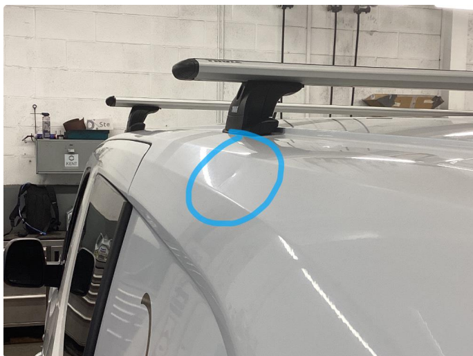
1.6 Bulk uten lakkskade