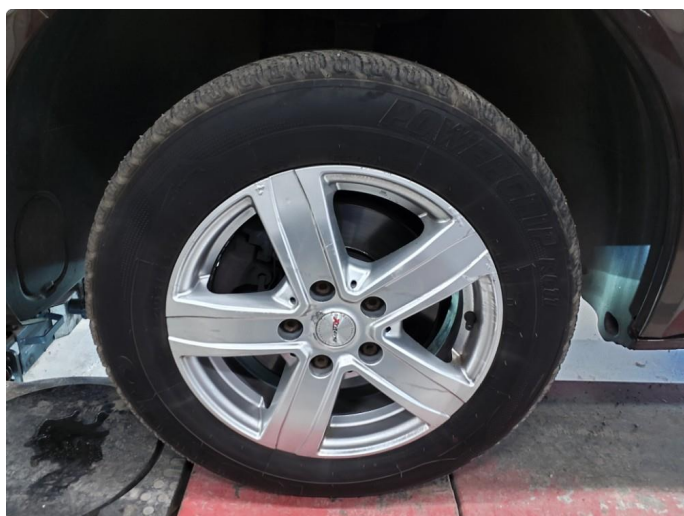
1.5 Betydelig oksidering