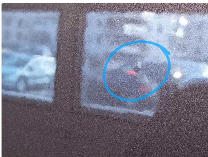
1.3 Øvrige feil