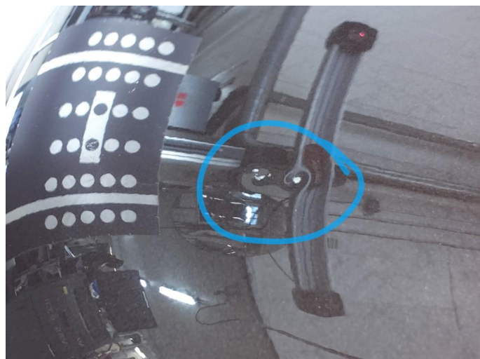
1.1 Bulk med lakkskade