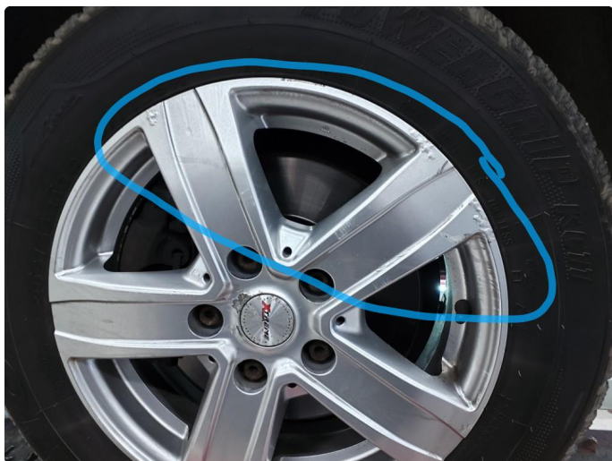
1.5 Betydelig oksidering