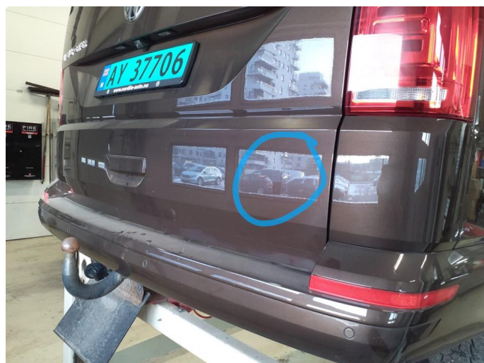
1.3 Øvrige feil