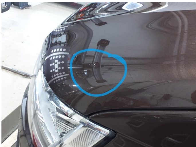
1.1 Bulk med lakkskade