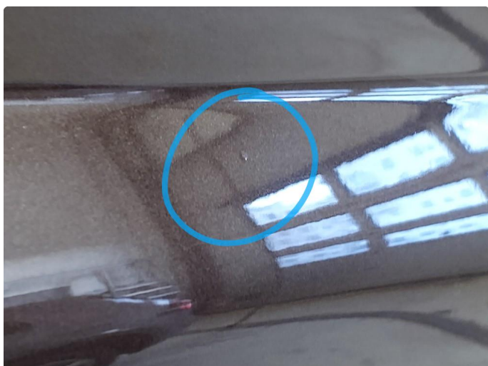
1.2 Øvrige feil