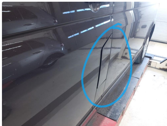
2.1 Øvrige feil