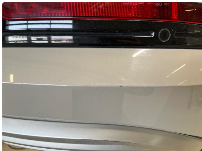
1.1 Noe bruksmerker på støtfanger bak.