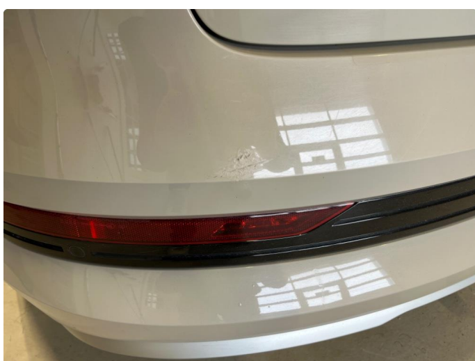
1.1 Noe bruksmerker på støtfanger bak.