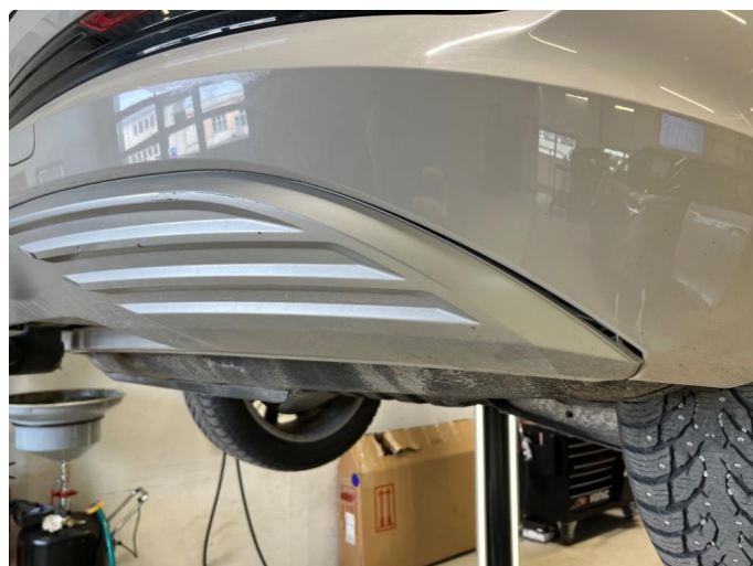
1.1 Noe bruksmerker på støtfanger bak.