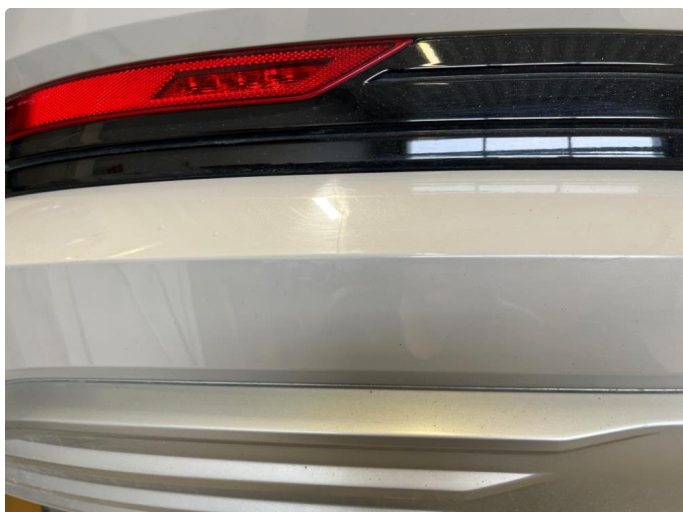
1.1 Noe bruksmerker på støtfanger bak.