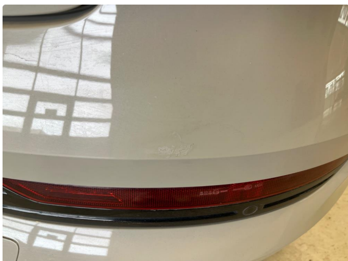
1.1 Noe bruksmerker på støtfanger bak.