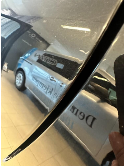
1.1 Liten ripe.