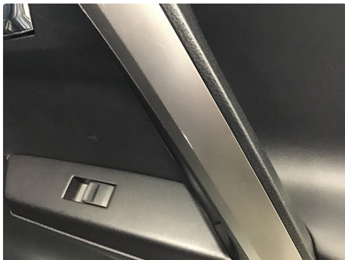
3.2 List skadet