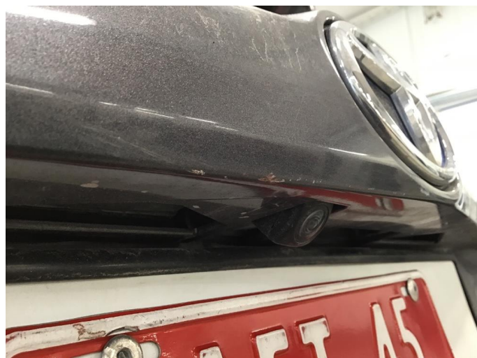
1.3 Noen riper