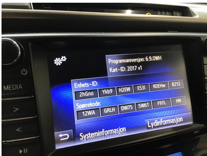
3.3 Navigasjon ikke oppdatert