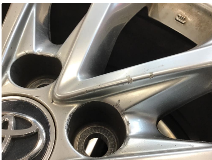
1.4 Skade på felg