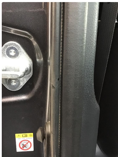
1.2 Pakning skadet