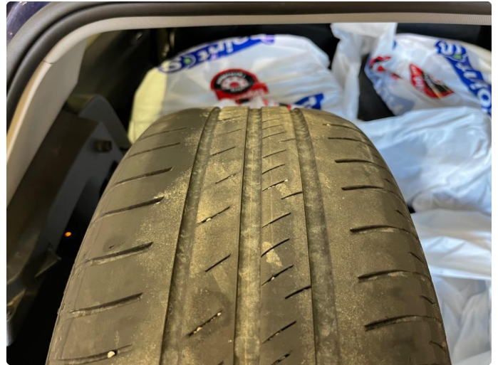
1.2 Sommerdekk foran begynner å bli slitt.