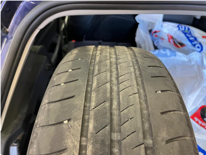
1.2 Sommerdekk foran begynner å bli slitt.