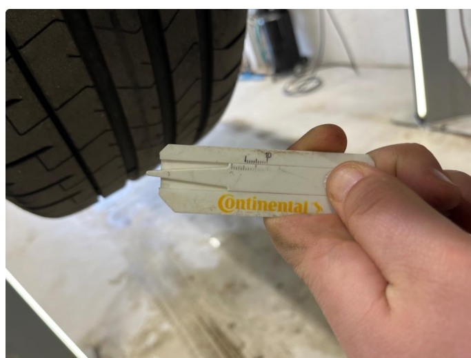
1.2 Sommerdekk fra 2018. Godt mønster.