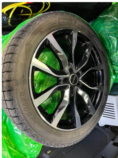
1.1 Vinterdekk fra 2018. Godt mønster.