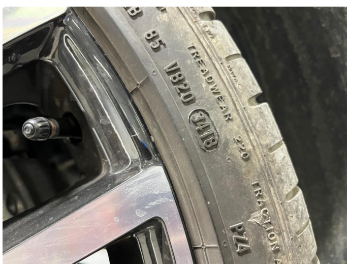
1.2 Sommerdekk fra 2018. Godt mønster.