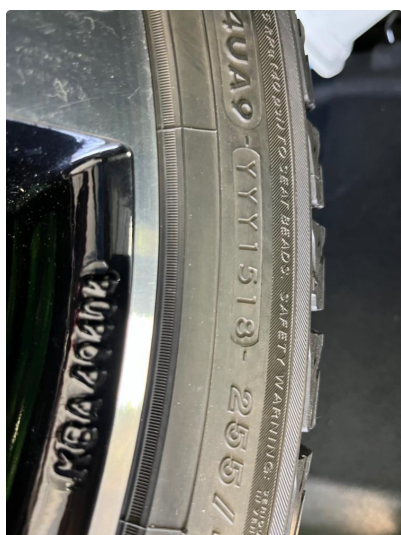
1.1 Vinterdekk fra 2018. Godt mønster.