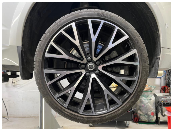
1.2 Sommerdekk fra 2018. Godt mønster.