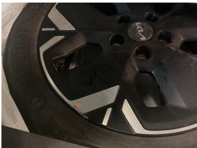
1.3 Noe skrammer