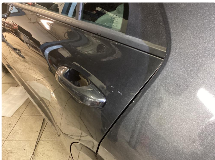
1.1 Noe smått riper/penslet