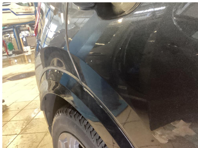
1.2 Liten p-bulk.