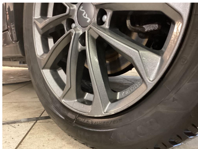
1.4 Litt kantkjørt.