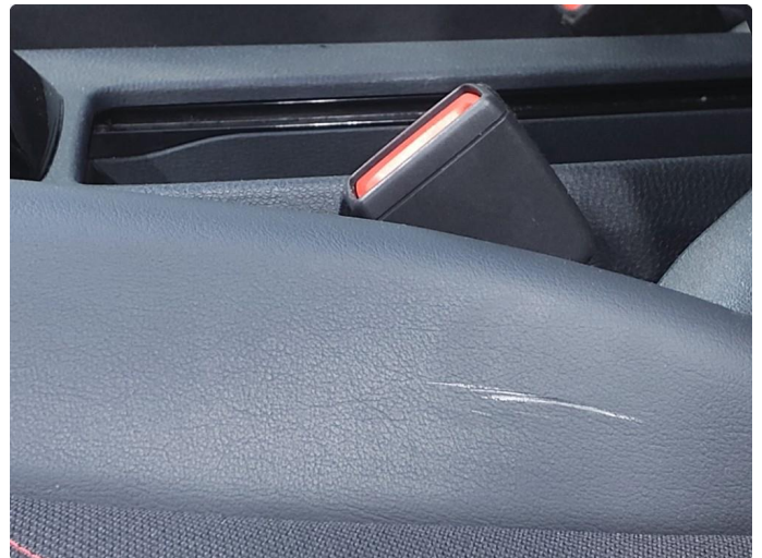
2.1 Øvrige feil