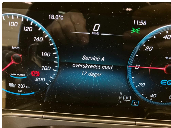
2.1 Varsler service Kommentar: Service blir utført 29.05