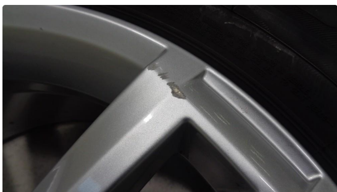
1.4 2 stk felger har kantkjøringer/skraper