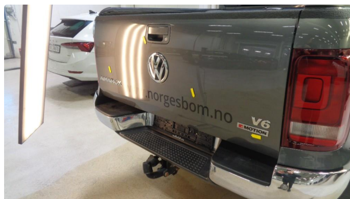
1.3 Noen små bulker på bakluke