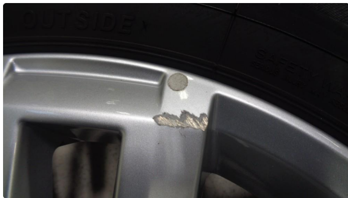
1.4 2 stk felger har kantkjøringer/skraper