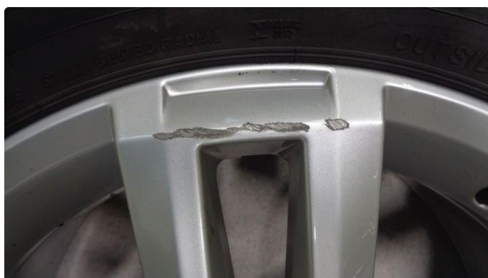
1.4 2 stk felger har kantkjøringer/skraper