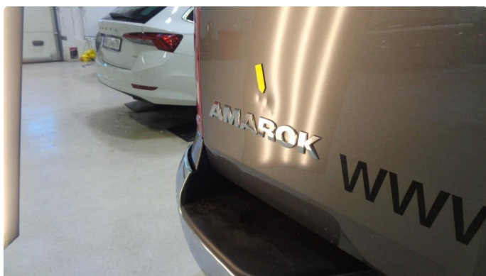
1.3 Noen små bulker på bakluke