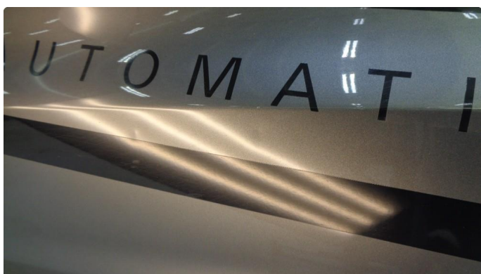
1.1 2 småbulker høyre bakdør.