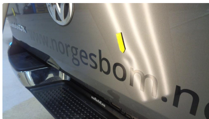
1.3 Noen små bulker på bakluke