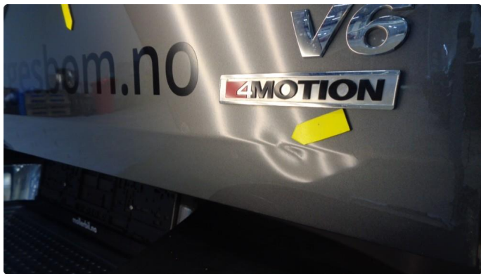
1.3 Noen små bulker på bakluke