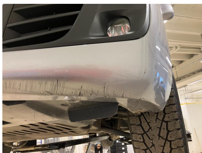
1.2 Skrubbskader underkant