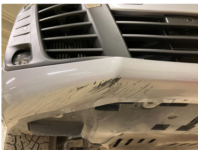
1.2 Skrubbskader underkant