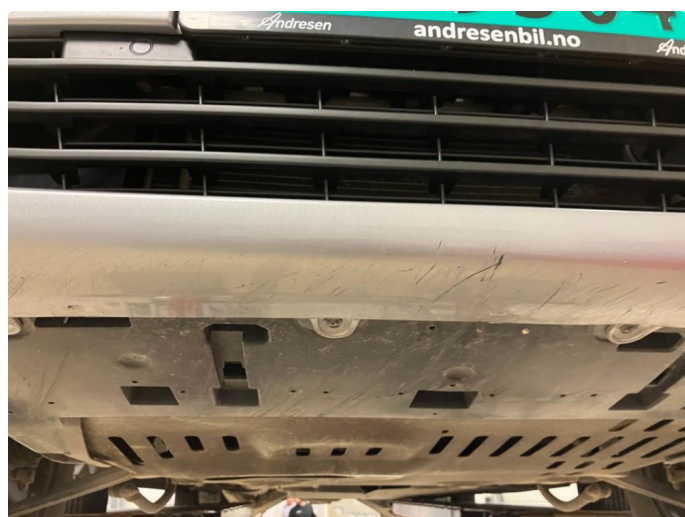
1.2 Skrubbskader underkant