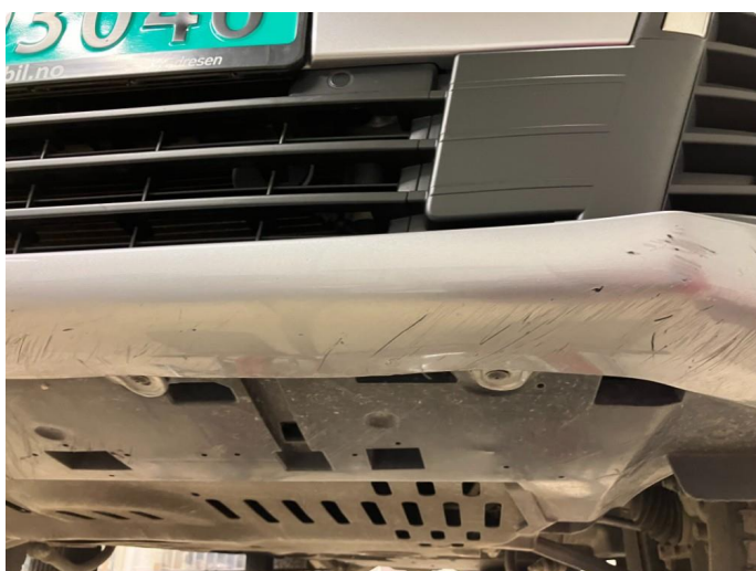
1.2 Skrubbskader underkant