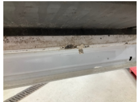
42. Venstre fordør