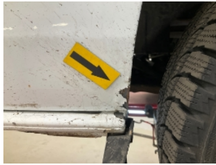
38. Høyre fordør