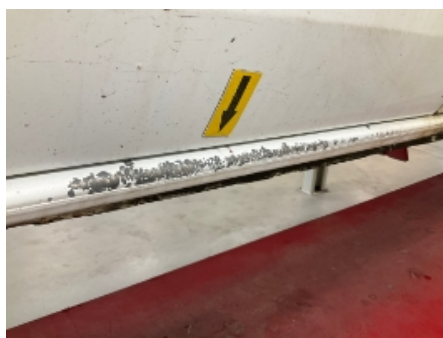
35. Venstre kanal