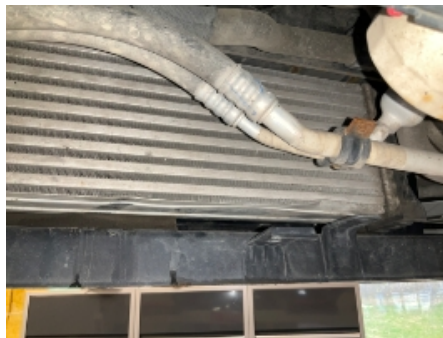
32. Utvendig tilstand motor