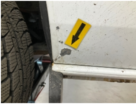
37. Venstre fordør