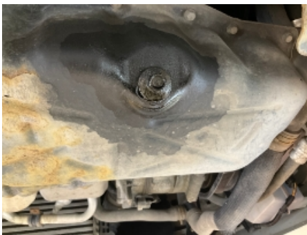
28. Utvendig tilstand motor