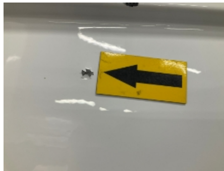
44. Høyre bakskjerm