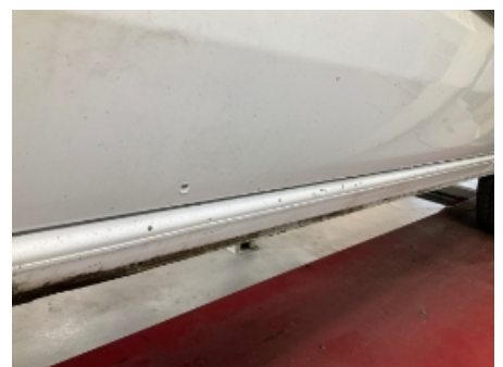
36. Venstre kanal