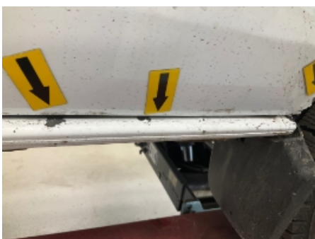
34. Høyre kanal