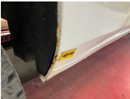
43. Høyre bakskjerm